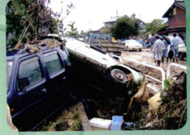
災害時の仮設トイレに。