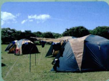
野外、市街地でのイベント会場に。