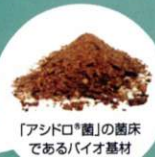
「アシドロ®菌」の菌床 であるバイオ基材

アシドロ®菌は高い分解能力を発揮する「高温アシドロ®コンポスト化プロセス」です。糞尿の分解力が1年~2年間持続するという驚異的な持続性も兼ね備え、もちろん人体にも無害です。